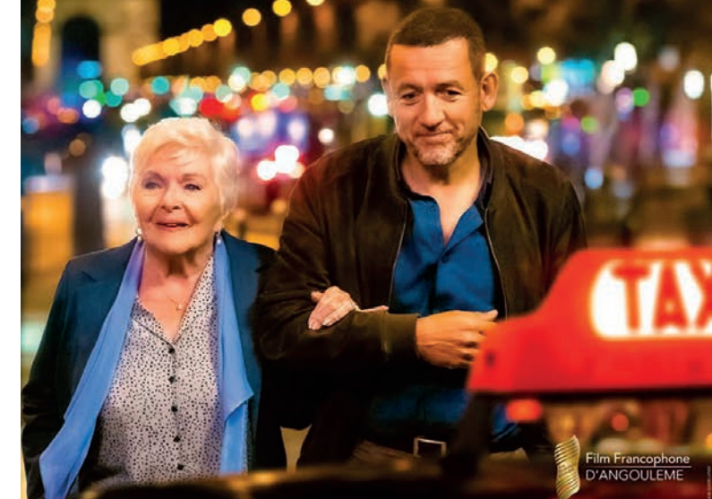
Film Francophone D'ANGOULEME

rue des trois frères Nadeau 17700 SURGERES - 05 46 07 00 00 cinema.surgeres@wanadoo.fr www.lepalace-surgeres.fr